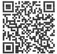
ลงทะเบียนออนไลน์